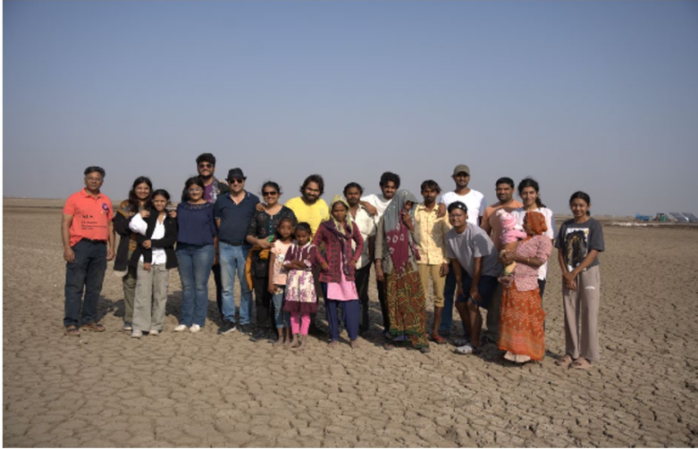
चित्र 6 अगरिया परिवार के साथ फिल्म निर्देशक एवं कर्मीदल