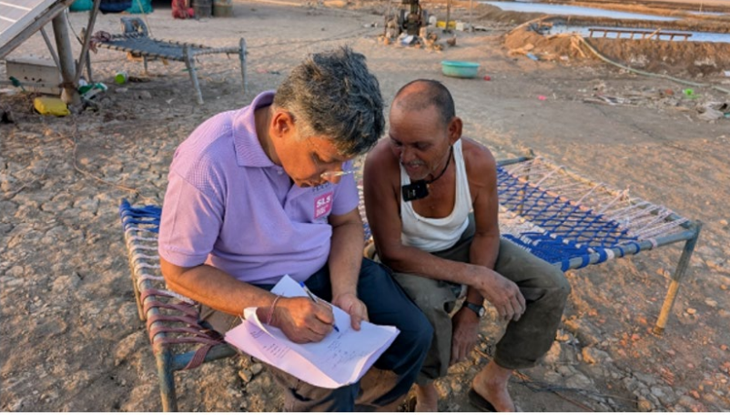
चित्र 3 प्रतिभागी अग्रिया से वार्तालाप