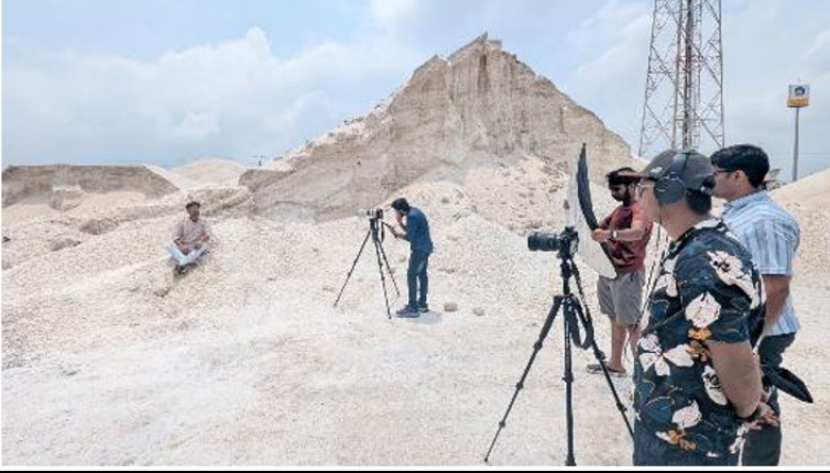
चित्र 5 लोकेशन पर कैमरा सेटअप और साक्षात्कार के दृश्य।