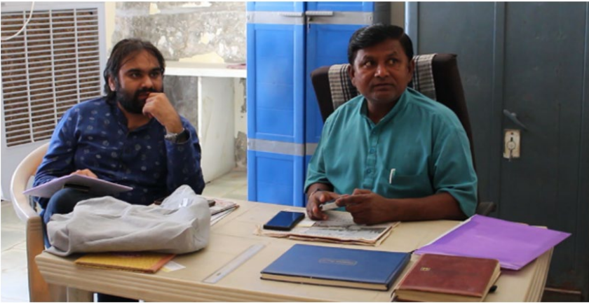
चित्र 2 स्क्रिप्ट संवरचना एवं समीक्षा (अगरिया हित रक्षक समिति, पाटडी)