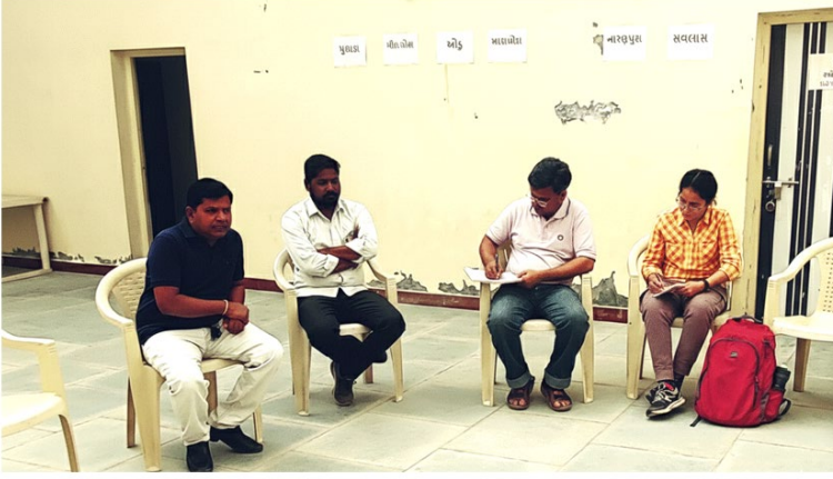
चित्र 1 फील्ड नोट्स एकत्रित करते हुए (अगरिया हित रक्षक समिति, पाटडी)