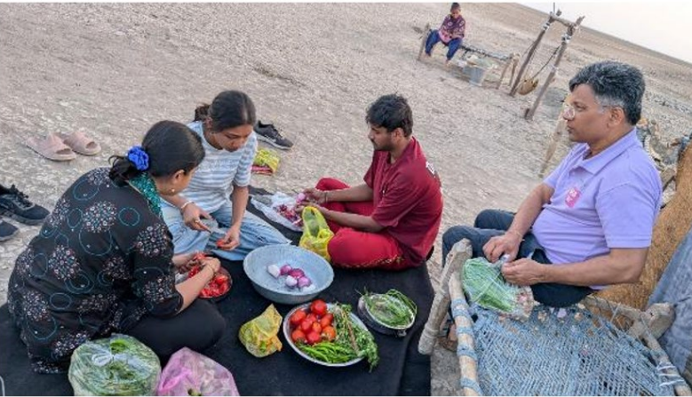
चित्र 4 अग्रिया परिवार के साथ भोजन